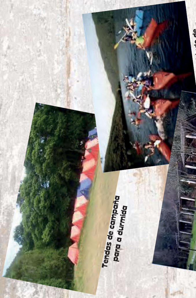
Tendas de campaña para a durmida